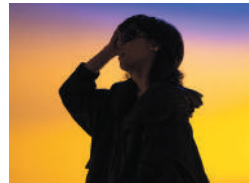
16:00～ Aile The Shota