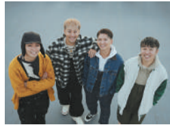
15:00～ THE FRANK VOX