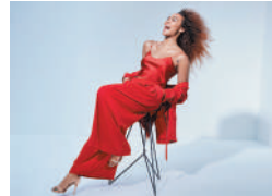
16:00～ Crystal Kay