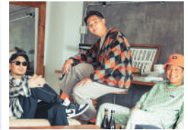
17:00～ ベリーグッドマン